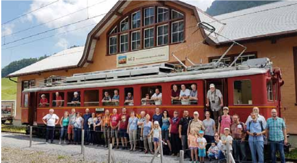
Stelldichein vor dem «Drissgi» in Wasserauen

Am 30. Juni 2018 haben mehr als 40 Mitglieder der Öchsle Bahn ihren Vereinsausflug zu unserem Verein unternommen. Die Fahrt führte von Altstätten über den Stoss nach Gais und weiter über Appenzell nach Wasserauen. Dort wurden die Mitglieder von unserem Catering Team