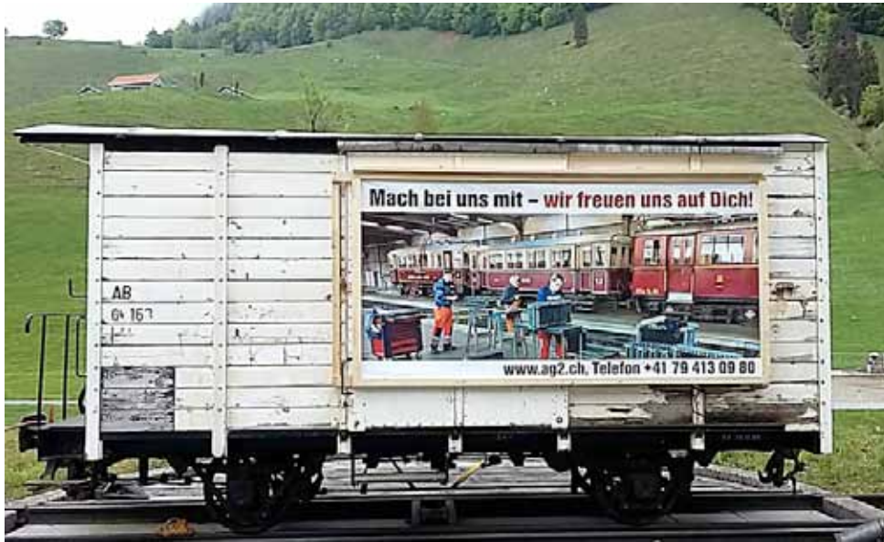
Die Arbeit geht nie aus...