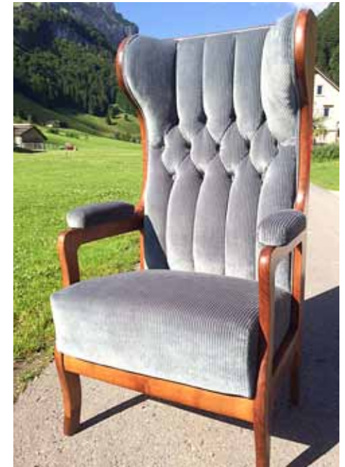
Wunderschöner Polstersessel und rustikale Drittklassbänke mit Hutständer