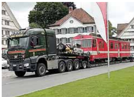
Triebwagen 11 verlässt die Heimat Gais

Die Triebwagen BDeh 4/4 11 – 15 und die zugehörigen ABt 111 – 115 mit Baujahr 1981 werden an die Achenseebahn abgegeben. Die ersten beiden Triebwagen BDeh 4/4 11 und 12 sind bereits nach Jenbach, Österreich, transportiert worden. Über die Veränderungen des Rollmaterials für die Linie Gossau – Appenzell – Wasserauen werden wir im nächsten Mitteilungsblatt orientieren.