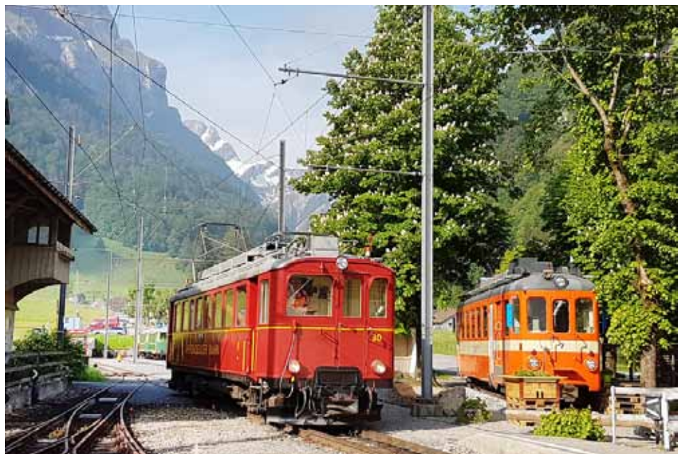
Neue Begegnungen: s'Drissgi der AB trifft in Wasserauen den BDe 4/4 7 der Trogenerbahn

Der Triebwagen BDe 4/4 Nr. 7 hat am 11. April 2018 eine weniger weite Reise nach Wasserauen angetreten. Er wurde durch die Emil Egger Transporte auf der Strasse