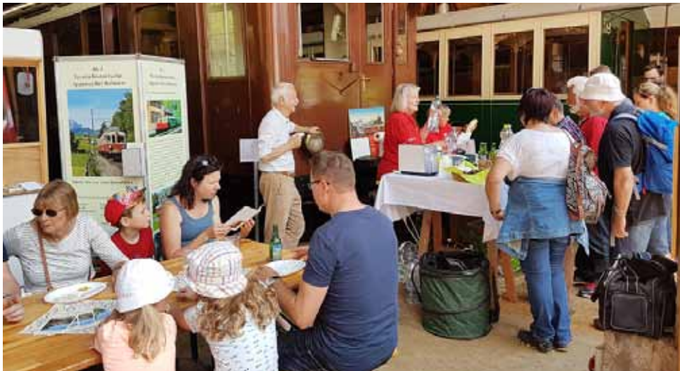
Schmackhafte Verpflegung in historischer Umgebung

verpflegt. Nach ausführlicher Besichtigung der historischen Depotwerkstätte und der Ausstellung des Museumsvereins traten sie die Heimfahrt mit dem «Drissgi» nach Herisau – Gossau an. Der Besuch hat uns sehr gefreut.