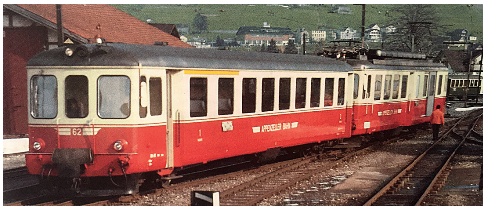
Einfahrt eines BDe 4/4-Pendelzuges in Appenzell