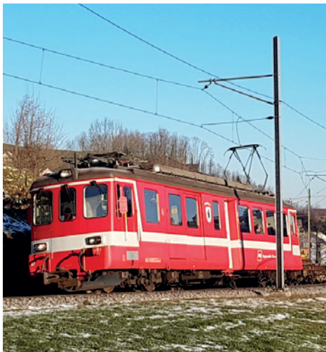
Wohl einer der letzten Einsätze des BDe 4/4

übergeben. Ganz besonders freut sich Alexander Bless über das Wappen von Waldstatt, hat ihn in diesem Dorf, auf dem Balkon der Grosseltern der «Appenzeller Bahn» Virus gepackt. Hinweis: Dieser Virus kann ansteckend sein, ist aber für die Gesundheit der befallenen Personen völlig harmlos.