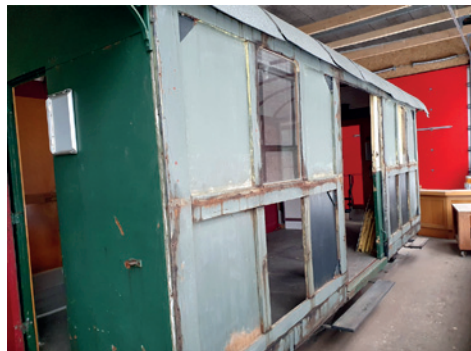
Der D 165 wird von der Verblechung befreit

zwischenlagert werden, bis die AB die Erweiterung des Relaisraums abgeschlossen hat. Es muss rund um diesen Raum genug freier Platz für die Handwerker vorhanden sein und auf dem 3. Gleis muss die AB mit dem Zweiweg-Lastwagen das Material ins Bahndepot fahren können. Wir wollen die Gelegenheit nutzen und